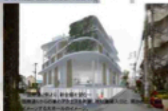
「都市丘陵」を築き上げるのがこのビルだ。それにはもちろん、この建物がその場所を「憩いの場」として作りださなくてはならない。