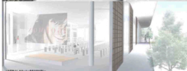
「北風角より、大ホールへ直達する通路」 直達通路は、人々の動きを促す。直達通路の両側のホールを見渡し、風通しと「直達」します。見通しの良い空間を考慮し、一般利用者のための開放的な空間として計画します。ホールは直達通路に直結して、壁からフロアまで見渡す。可動天井の開放感と見通しの良い空間を確保し、見通しの良い空間を確保します。