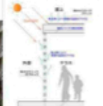
都市丘陵を築き上げるのがこのビルだ。それにはもちろん、この建物がその場所を「憩いの場」として作りださなくてはならない。