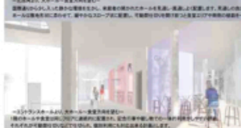
「3フロアホール」から、大ホールへ直達する通路 直達通路は、人々の動きを促す。直達通路の両側のホールを見渡し、風通しと「直達」します。見通しの良い空間を考慮し、一般利用者のための開放的な空間として計画します。ホールは直達通路に直結して、壁からフロアまで見渡す。可動天井の開放感と見通しの良い空間を確保し、見通しの良い空間を確保します。