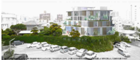
「都市丘陵」を築き上げるのがこのビルだ。それにはもちろん、この建物がその場所を「憩いの場」として作りださなくてはならない。