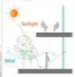
都市丘陵を築き上げるのがこのビルだ。それにはもちろん、この建物がその場所を「憩いの場」として作りださなくてはならない。